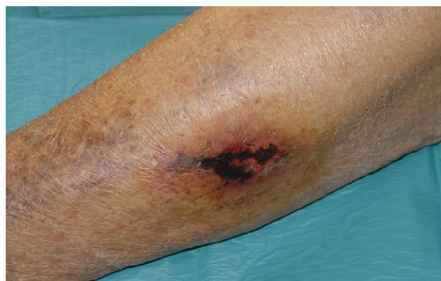
Figura 2. Calcifilaxis (fecha: 20/11/2008).

Aunque se han visto casos aislados de lesiones de calcifilaxis en pacientes sin deterioro de función renal (tienen hiperparatiroidismo primario, cáncer, enfermedad inflamatoria intestinal, etc.), esta entidad es casi exclusiva de pacientes con insuficiencia renal: diálisis (1-4%), prediálisis y trasplantados 1 .