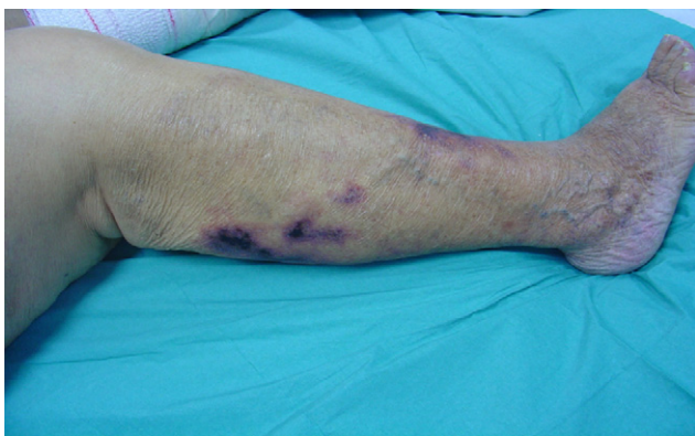
Figura 5. Calcifilaxis (fecha: 10/12/2008).

Su incidencia más elevada en pacientes en diálisis se debe al incremento de supervivencia de pacientes en diálisis, el envejecimiento, la mayor prevalencia de arteriosclerosis y la diabetes mellitus, el uso de captadores de P que contienen Ca y la administración de vitamina D 1,2 .