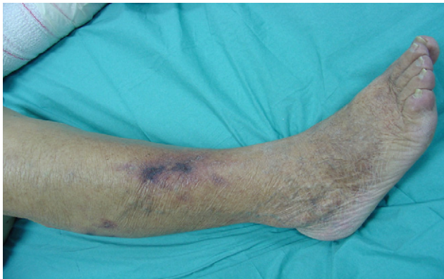
Figura 4. Calcifilaxis (fecha: 4/12/2008).