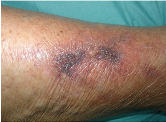
Figura 3. Calcifilaxis (fecha: 30/11/2008).