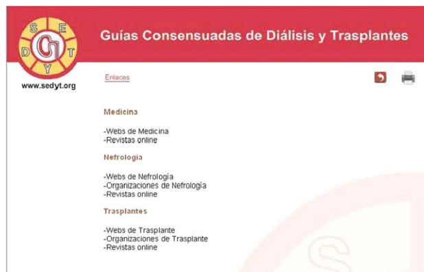
Figura 3. Enlaces de Internet de medicina, nefrología y trasplantes.