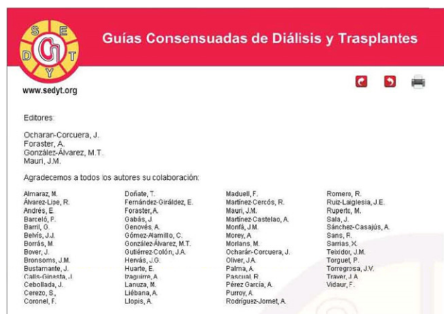
Figura 2. Relación de los autores de las guías consensuadas de diálisis y trasplante.

Las guías consensuadas de Diálisis y Trasplante han sido las siguientes: