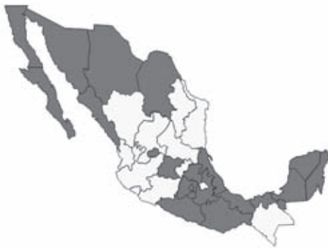
Figura 1. Mapa de los estados de México que han colaborado en el registro.

Aguas Calientes Baja California Baja California Sur Campeche Coahuila Chiapas Chihuahua Distrito Federal Estado de México Guanajuato Guerrero Hidalgo Morelos Oaxaca Puebla Quintana Roo Sonora Sinaloa Tabasco Veracruz Yucatán