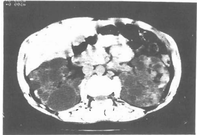
Figura 3. TAC: Presencia de múltiples quistes renales en ambos riñones.

siones, ni retraso mental. También se demostró, por radiología y/o TAC la presencia de calcificaciones cerebrales en los tres casos. El caso 2 presentaba además lesiones retinianas sugestivas de la entidad.