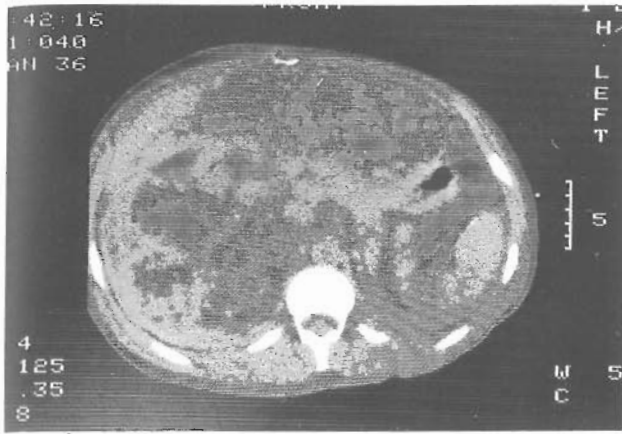
Figura 2. TAC: Riñón derecho aumentado de tamaño, con imágenes compatibles con angiomiolipoma.