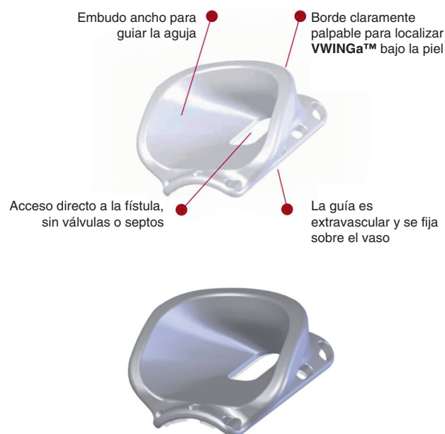
Figura 1 Orificios de sutura y localización del embudo de la guía VWNG.

vaso mientras se colocan las suturas ya que puede reducir la incidencia de suturar la pared posterior o una válvula.