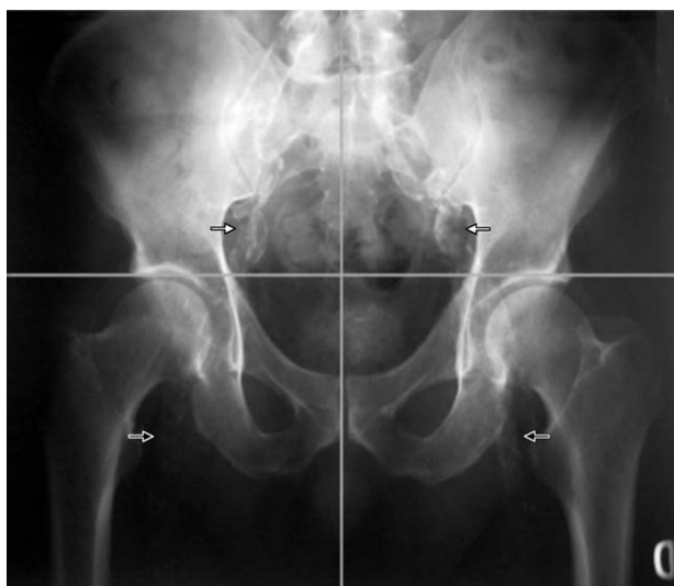
Figura 1 Calcificaciones en arteria femoral e iliaca.

calcificaciones en la arteria femoral, iliaca, radial y digitales (figs. 1 y 2).