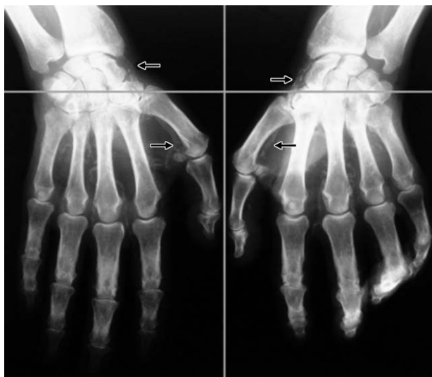
Figura 2 Calcificaciones en arteria radial.

Otra forma de evaluar semicuantitativamente las calcificaciones vasculares es mediante el Kaupilla score, con la realización de una Rx de perfil del abdomen (debe incluir las dos últimas vértebras torácicas y las dos primeras vértebras sacras). La arteria aorta con calcificación debe ser identificada como una estructura tubular por delante de la cara anterior de la columna vertebral. Sólo es considerado el segmento de la aorta abdominal correspondiente a la altura de la primera a la cuarta vértebra lumbar. La puntuación va de 1 a 3 (1 = leve, 2 = moderada, 3 = severa) de acuerdo a la longitud de cada placa calcificada identificada a lo largo del perfil anterior y posterior situado a nivel de cada vértebra lumbar tenida en consideración. Por lo tanto, el score puede variar desde 0 a un máximo de 24 puntos, correspondiendo a un máximo por vértebra de 6 puntos (severa = 3 anterior + 3 de posterior) teniendo en consideración las 4 vértebras lumbares. Bellasi et al demostraron una buena correlación